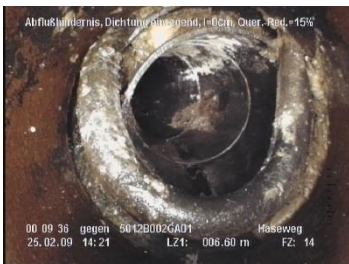
Abflusshindernis: einragende Dichtung

Aufgrund der zahlreichen und unterschiedlichen am Markt bestehenden Sanierungsverfahren ist das Heranziehen eines unabhängigen Fachmanns der Grundstein für eine langfristig wirksame Investition.